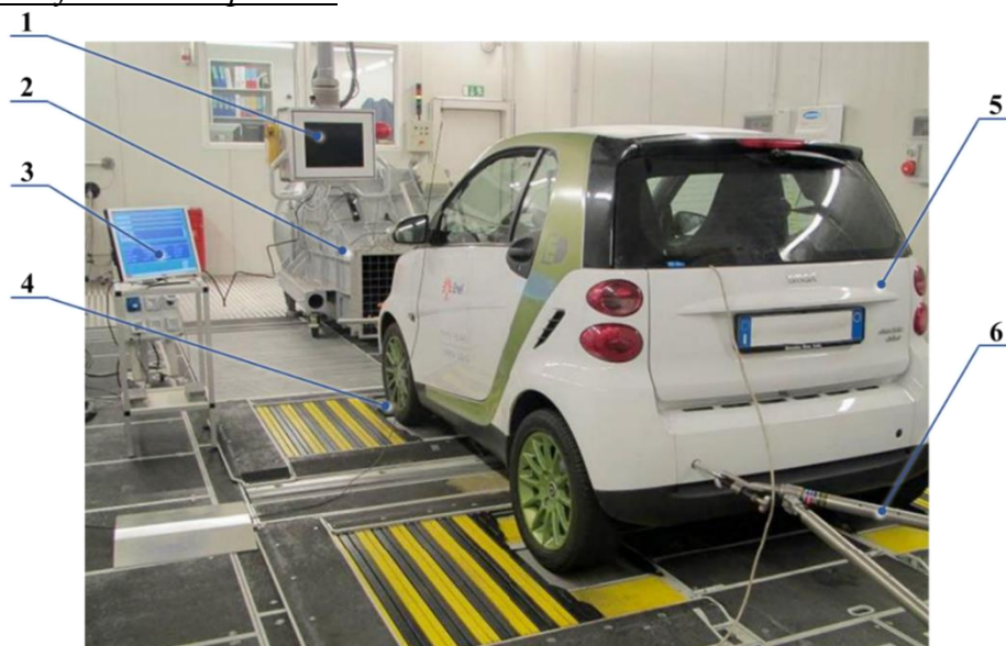
2.1. att. Automašīna testēšanas principiālā shēma:

1, 3 – datorizētā vadības platforma; 2 – ventilators; 4 – šasijas dinamometrs; 5 – testējamais automobilis; 6 – stiprinājuma atsaites