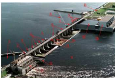
Ķeguma hidroelektrostacijas kopskats

1,15 – avankameras; 2,3,7 – sektora aizvari; 4,9 – segmenta aizvari; 5 – augšbjefs; 6 – vārstuļu aizvari; 8 – aizsargbonas; 10 – kreisā krasta zemes uzbēruma dambis; 11 – HES 1. ēka; 12 – Zivju ceļš; 13 – autoceļa tilts; 14 – ūdens pārgāznes aizsprosts; 16 – HES 2. ēka.