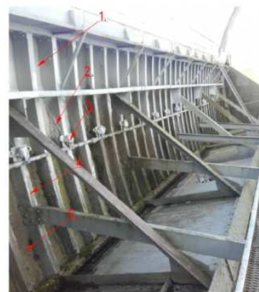
Segmenta aizvara virsma ar sildkabeļiem no lejasbjefa puses

Šo iemeslu pēc ir jāvēlti liela uzmanība aizvaru apsildei, neļaujot tiem ziemas laikā aizsalst, kas novestu pie to darbības traucējumiem.